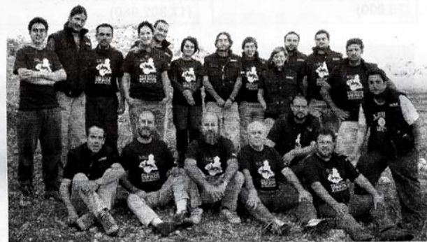
El equipo interdisciplinar que trabaja en la excavación. JUAN GALLARDO

A través del convenio de actuación entre la Fundación Adendia y el Proyecto Iberos Murcia, Adendia quiere fomentar la difusión del patrimonio arqueológico de la Región de Murcia, a través de la excavación arqueológica del conjunto ibérico de Coimbra del Barranco Ancho y de diferentes etapas de actuación como la publicación de una monografía que recoja la memoria de actuaciones realizadas entre 1998 y 2005 del yacimiento arqueológico de Coimbra, una puesta al día de los últimos resultados científicos obtenidos para ayudar a complementar el conocimiento que se tiene sobre el mundo ibérico en el Sureste peninsular, un trabajo exhaustivo en laboratorio donde se restaurarán piezas y se llevarán a cabo diferentes trabajos, además de preparar una exposición que se presentará en el museo de la Universidad de Murcia, ofertándose además su traslado a distintos centros de ámbito regional, nacional e incluso internacional.